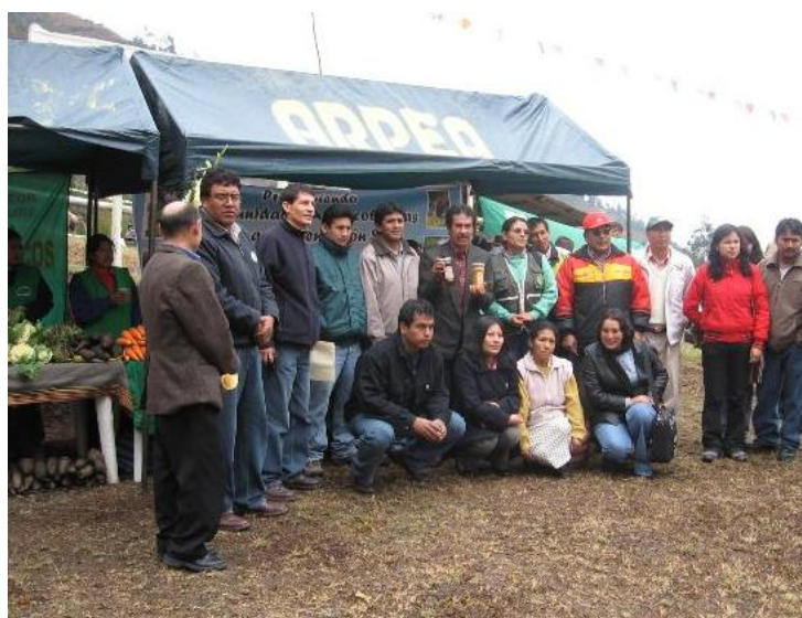
Reconocimiento al IDMA por Resolución Directoral al IDMA por parte del MINAG – DRA/AP, 2007.