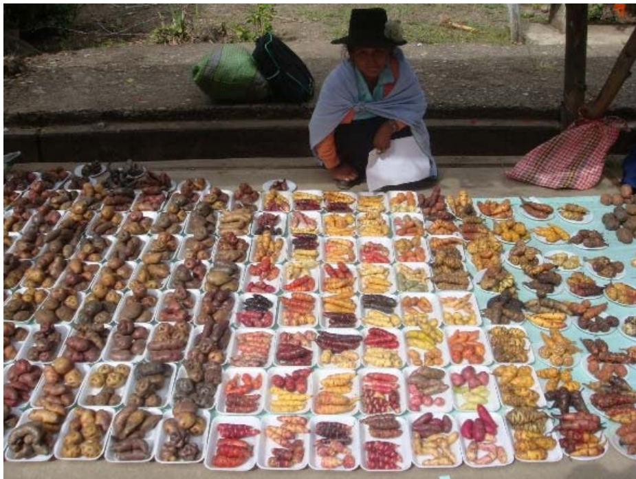
Feria de la Agrobiodiversidad en Kichki-Huánuco