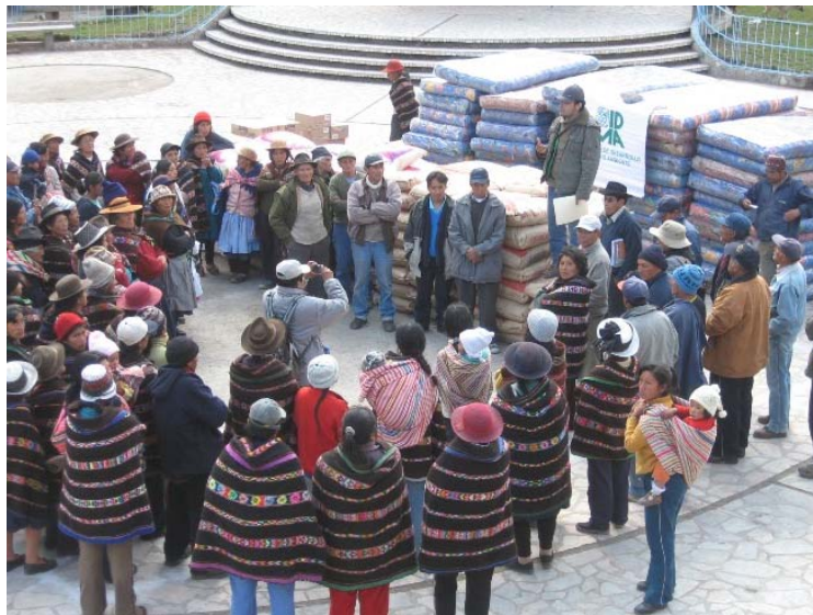
Apoyo humanitario en Laraos-Yauyos (terremoto agosto 2007)

Otro echo de importancia que aconteció durante el 2007 fue la extradición de Fujimori. Después de 20 meses de espera, desde la captura de Alberto Fujimori en Chile, la justicia de ese país, finalmente decidió aprobar los cargos que justifican su extradición. Siete fueron los casos que la Corte Penal aprobó, dos por violaciones a los derechos humanos: las matanzas de Barrios Altos y La Cantuta que incluye el caso de sótanos del Servicio de Inteligencia del Ejército (SIE), y cinco por corrupción. Otro tema es lo que ocurra en términos judiciales y político en el país; son muchos los intereses en juego que podría hacer dudar de una sentencia ejemplar. Los organismos de derechos humanos, los familiares de las víctimas y la ciudadanía tienen que estar alertas y hacer un seguimiento a este mega-proceso.