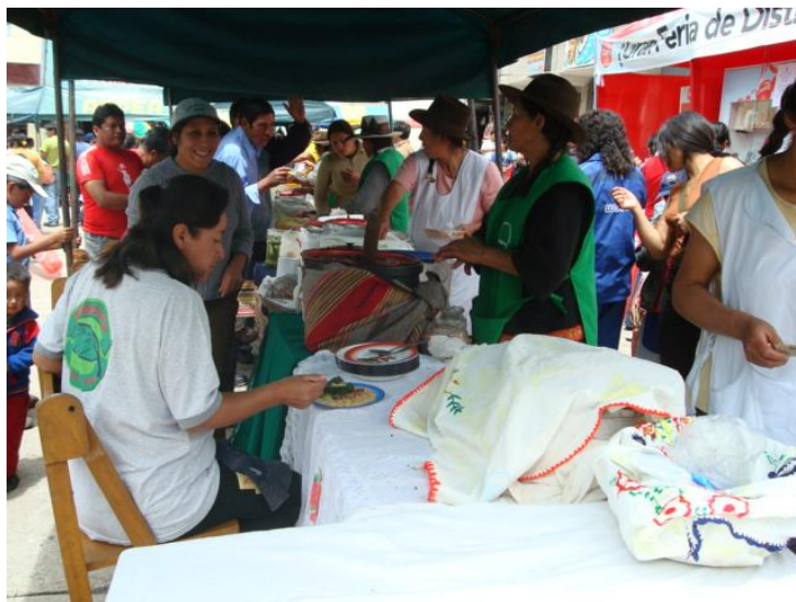
Primer Festival de la Comida Típica Tradicional, Microcuenca Mariño