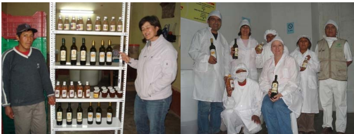
Transformación de productos: San José de los Chorrillos .

eventos a nivel de los ámbitos de los proyectos, involucrándose a un total de 350 agricultores/as de 8 comunidades, con quienes se ha logrado el desarrollo de capacidades en selección de productos, manejo post cosecha, transformación y mercado.