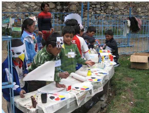
Trabajo psicosocial en Laraos, Yauyos 2007

De este modo el IDMA, respondió ante la emergencia, seguro de haber contribuido y ayudado a la población atendida. También quedamos contentos por que los vínculos iniciados con los líderes locales, autoridades municipales y población en general creemos será de largo aliento.