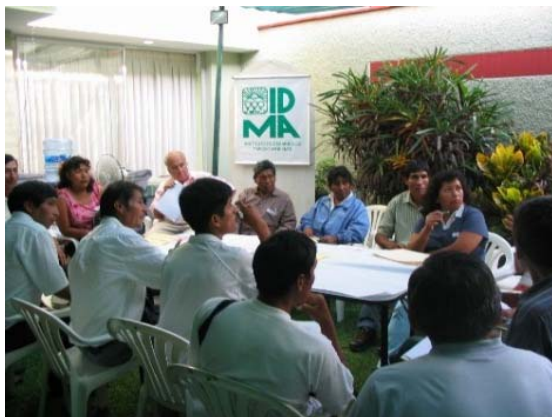
Taller ARPE Lima sobre SGP. (local IDMA)

Asimismo, se ha diseñado y puesto en práctica, las herramientas que se utilizan en el SGP como fichas de registros, evaluación, informes, manuales de procedimientos, entre otros. Actualmente existen 8 núcleos locales en la cuenca del Lurín, 5 en la cuenca del Rímac (con el apoyo de ISAT), 5 núcleos locales en Huánuco, y 7 núcleos locales en el valle del Mantaro; donde participan alrededor de 450 productores.