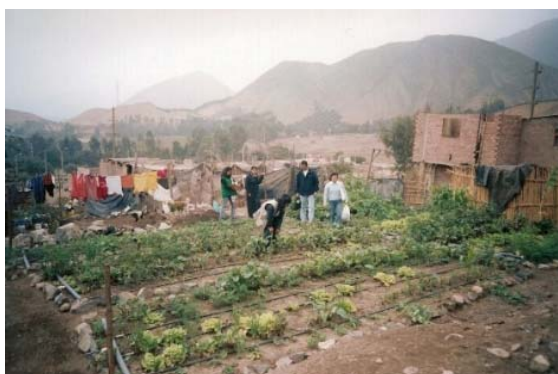
Agricultura periurbana en Lurín.