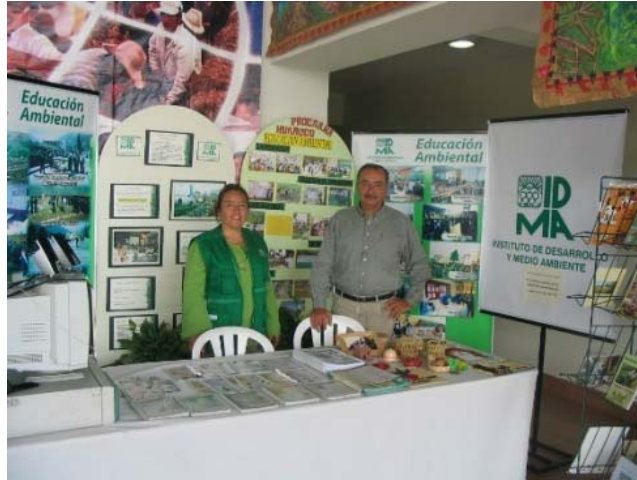
Feria de Educación Ambiental organizada por MED