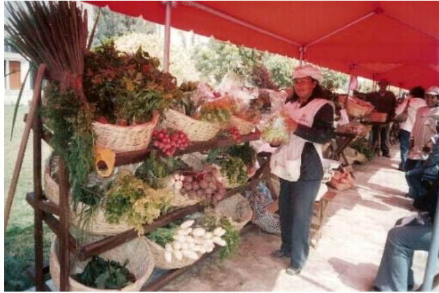
EcoFeria de Cieneguilla

ecológicos que no cuentan con la certificación ecológica por terceros de sus productos, y de esta manera brindar un producto sano y a un precio justo tanto para el productor como para el consumidor, y de esta manera promocionar el consumo de los productos ecológicos a nivel de todos los estratos sociales, más aún si sabemos que el 85% de los ciudadanos de Lima Metropolitana pertenecer a un nivel socio económico bajo, y que también tienen derecho a consumir productos sanos.