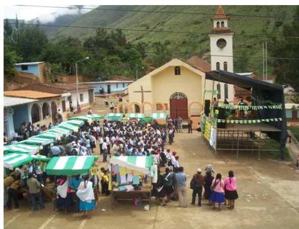
Feria de Huarichaca –Molino-

Asimismo, se ha organizado por segundo año consecutivo la “Feria de agrobiodiversidad” , que se desarrolló en el centro poblado menor de Huarichaca, distrito de Molino , donde participaron como expositores de la diversidad, 18 agricultores. Por otro lado, los agricultores que mantienen la diversidad de papas nativas de pulpa amarilla han participado en el “X Festival Regional de la Papa Amarilla” , donde ha participado 13 promotores productores (05 del distrito de Kichki y 08 del distrito de Molino).