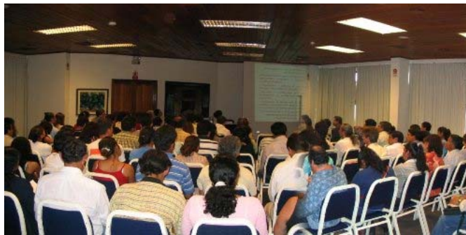
Taller de GALCI en Lima 2006

Finalmente se ha percibido durante el proceso de presentación de planes de gobierno regional y local de nuestras futuras autoridades una actitud más planificada y comprometida con la sociedad civil, analizando la problemática de nuestra región y estableciendo compromisos con el desarrollo económico y social, principalmente en las zonas rurales, donde se encuentra los mayores índices de pobreza de nuestra región.