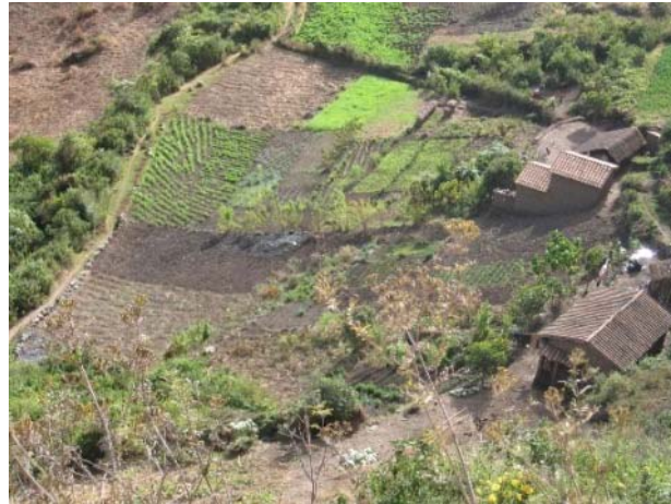
Chacra Integral Agroecológica

Se apoyaron experiencias piloto de producción agroecológica con promotores agroecológicos en las microcuencas Mariño, Acco, Pichirhua y Challhuaní. Estas actividades han estado dirigidas a demostrar y validar con algunas familias, innovaciones tecnológicas productivas como la instalación de módulos familiares de riego por aspersión, crianza de cuyes, manejo de pastos forrajeros, abonamiento orgánico, crianza de abejas; asimismo, el incremento y mejoramiento de la calidad en la producción de hortalizas; todo ello, con el propósito primero de garantizar la seguridad alimentaria y después darle una viabilidad ventajosa de los excedentes para el mercado.