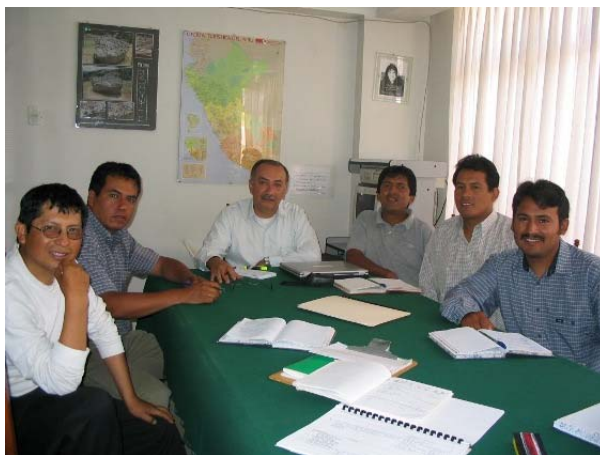
Visita al equipo IDMA-Abancay 2006

Como se podrá apreciar en el cuadro de Gestión de Proyectos en ANEXOS, se han trabajado y aprobado nuevos proyectos. El proyecto AAA-UE-HIVOS y 5 contrapartes peruanas para el Programa Rural Andino-RURANDES, fue aprobado; entró en funcionamiento a partir de abril del 2007. Este proyecto involucra al Programa de Huánuco con una duración de 4 años y por un monto de US$ 416.000. El proyecto BID-FOMIN fue aprobado el perfil recientemente en abril; contribuyen a este proyecto trienal el FONDAM y el Gobierno Regional de Huánuco. Igualmente el proyecto de Hampshire Foundation, se aprobó por un monto de US$ 50.000 para el Programa IDMA-Lima – Lurín, este proyecto se inició en abril del 2007. En el caso de Manos Unidas luego de la respuesta positiva para un nuevo proyecto y la visita de la misión en marzo, se entró a la fase de elaboración y negociación del nuevo proyecto para el período dic. 2007-nov. 2010 por un monto de US$ 400.000; proyecto que fue aprobado a mediados de junio (ver cuadro). Asimismo se aprobó el proyecto sobre Agricultura Urbana en cofinanciamiento entre AAA-HPI, para el Programa Lima-Lurín. Igualmente se aprobaron dos proyectos especiales sobre educación ambiental y el Sistema de Garantía Participativo de la producción agroecológica, apoyados por el FONDAM por US$ 10.000 cada uno. Igualmente en el 2006 se aprobaron nuevos proyectos.