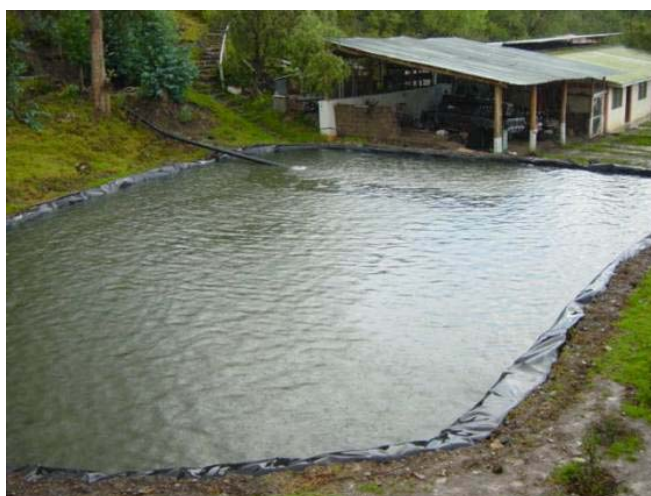
Reservorios con geomenbrana

De acuerdo a la realidad de los terrenos del ámbito de intervención, y con el interés de los agricultores por conservar y mejorar sus suelos, se han realizado acciones de control de erosión, lográndose intervenir un total de 128 has. de terreno de ladera con conservación de suelos, empleándose las técnicas de terrazas de formación lenta con pastos, champas y piedras, cercos vivos, agroforestería, forestación y terrazas banales. Adicionalmente para el logro de estas actividades se han conducido 29 viveros donde se han producido un total de 120 mil plantones de diversas especies e instalado 64.500 esquejes de pastos mejorados.